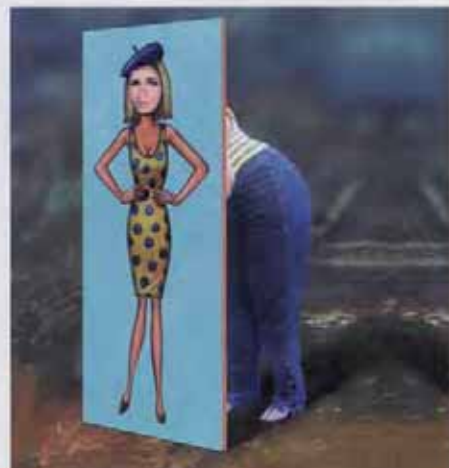
Varsågod, i det här numret får du snälla viktråd. sid 91