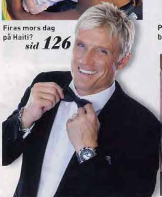
Mer attraktiv än någonsin! Dolph är en retro-hunk. sid 108