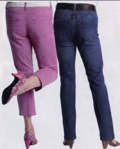
Putruppa eller plattstjärt – det finns byxor för alla. sid 70