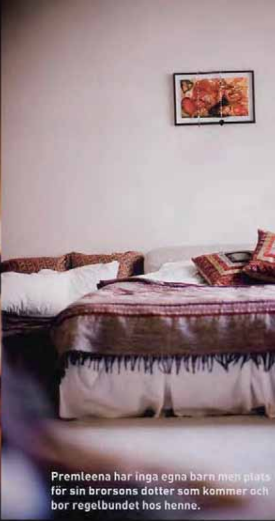
Premleena har inga egna barn men plats för sin brorsons dotter som kommer och bor regelbundet hos henne.

”Jag kände att jag inte orkade leva så här längre. Vad är meningen? Vem är jag i alltihop?”