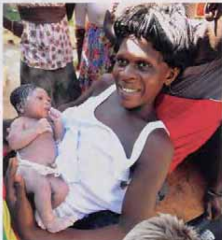
Firas mors dag på Haiti? sid 126